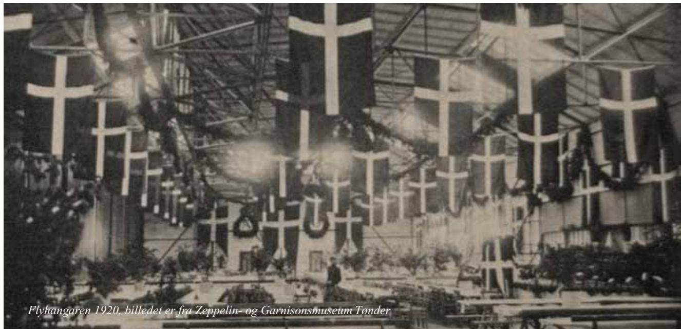
Flyhangaren 1920

En googlesøgning på „Genforeningen 2020 arrangementer“ giver 137.000 hits, så det kommer for vidt at kikke på dem alle, men redaktionen følger med og vil også bruge vores facebookside til at holde jer orienteret.