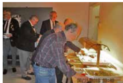
Kø ved ærterne

Derefter kunne dirigenten afslutte generalforsamlingen og beordre pause, mens der blev gjort klar til et aftenens andre højdepunkter: DE GULE ÆRTER