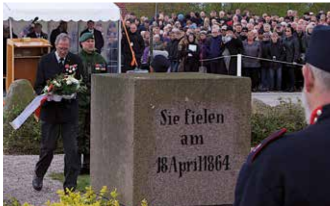
Verner på „arbejde“ for Forsvarsbrødrene på et af de utallige job han har udført gennem de mange år som kredsformand.

Så er vi startet på året 2020, jeg håber vores samarbejde bliver ligeså godt som i de foranliggende år.