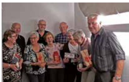
De glade vindere af skydningen