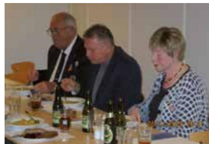
- Og de nydes

Da alle havde taget for sig af ærterne mindst to gange – nogle endda tre – og de var fortæret, var det tid til kaffe og småkager og det formelle.